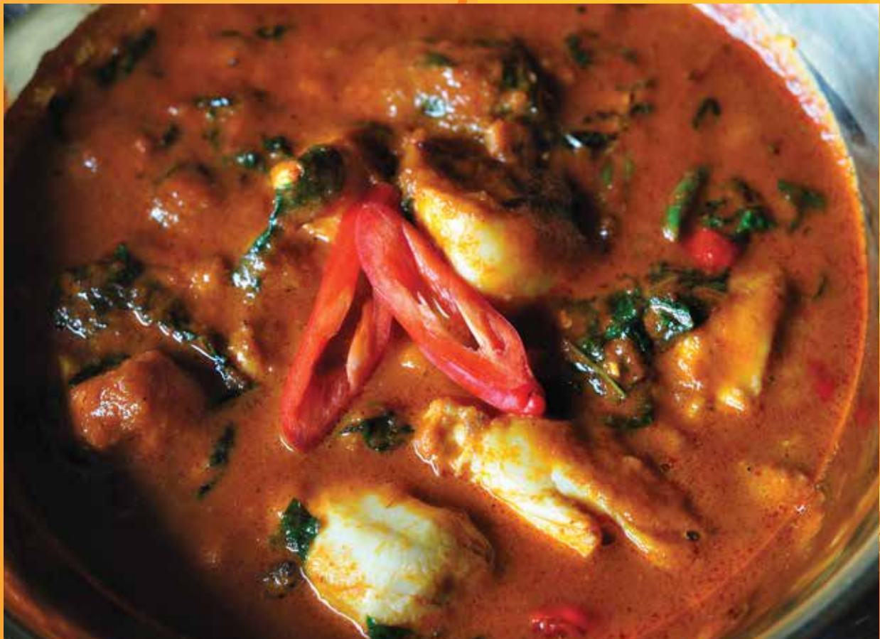
แกงเผ็ดเนื้อปูใบชะพลู Gaeng Crab Meat Bai Cha Plu