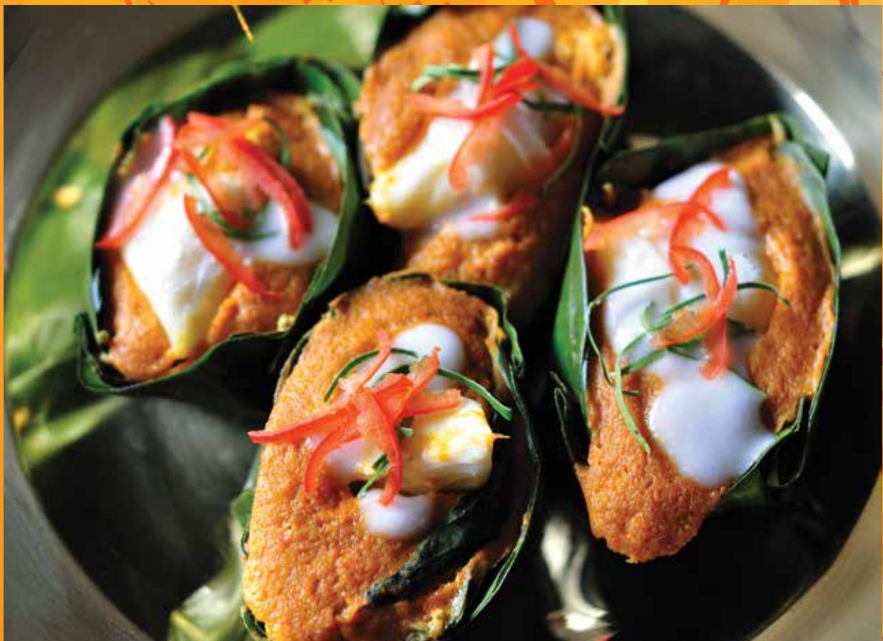
ห่อหมกเนื้อปู Hor Mok Crab Meat

Surat Thani's colossal crab meat lumps and crab roe in spicy red curry with cha plu leaves. Perfect match with rice or rice vermicelli.