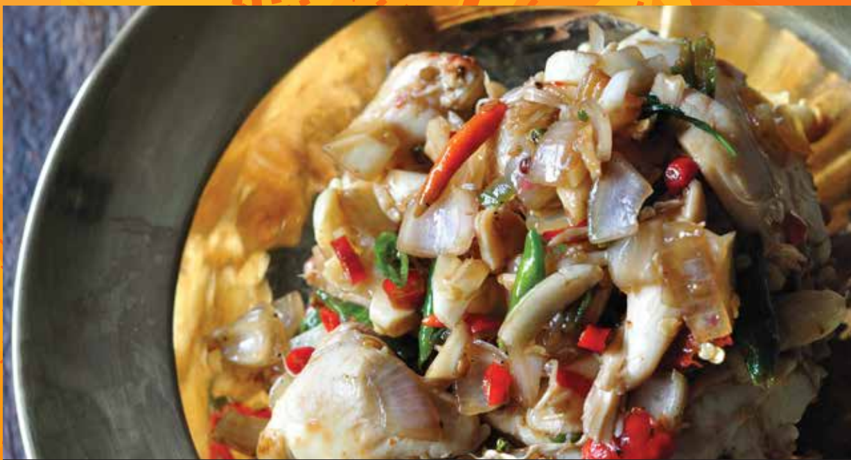
เนื้อปูผัดพริกชี้หนู Crab Meat Pad Prink Kee Nu

เนื้อกรรเชียงปูชิ้นโตจากสุราษฎร์ผัดกับพริกเหลือง หอมเครื่องแกงคั่วกลิ้ง Stir-fried Surat Thani's colossal crab meat lumps with yellow bell peppers and yellow chilli paste